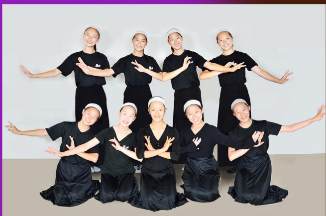
東京朝鮮第1初中級学校 舞踊部