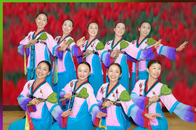
埼玉舞踊サークル