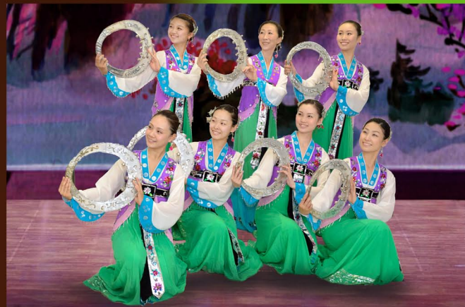
文芸同神奈川支部 舞踊部