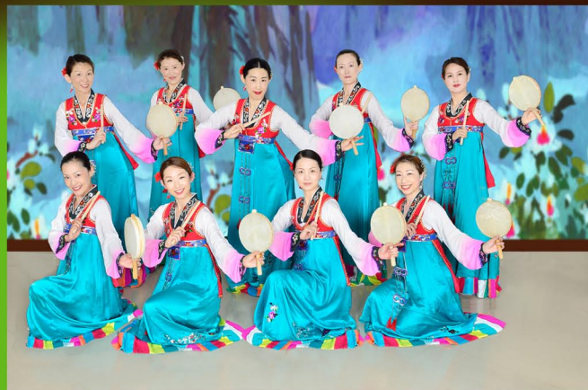
大田舞踊サークル